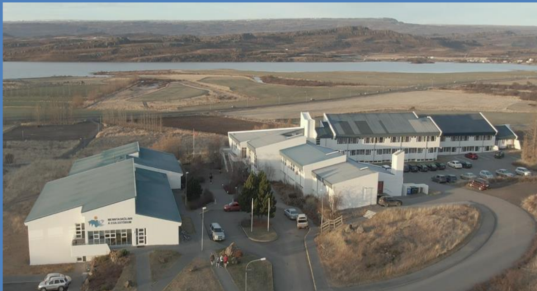
Skólabyggingar Menntaskólans á Egilsstöðum, október 2019.

Byggingar Menntaskólans á Egilsstöðum eru staðsettar við Tjarnarbraut 25. Skólinn er bóknámsskóli og kennsluhættir eru leiðsagnarnám í áfangakerfi.