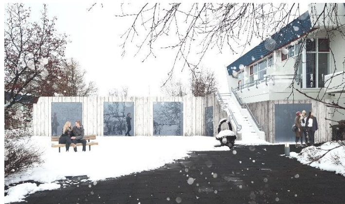
Mynd 4. Hugmynd – tengigangur séður frá stétt milli húsa

Stjórnendur skólans leggja til við MMR að lögð verði vinna við hönnun tengigangs milli heimavistar og kennsluhúss ME.