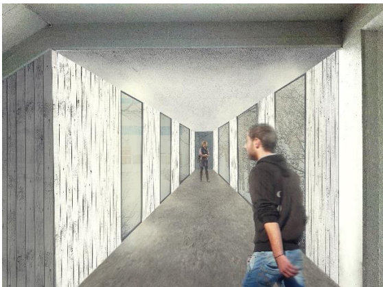
Mynd 3. Hugmynd - inni í tengigangi milli húsa