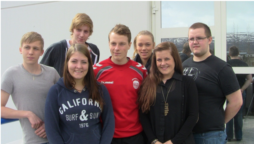
Rýnihópur nemenda skólaárið 2011-2012